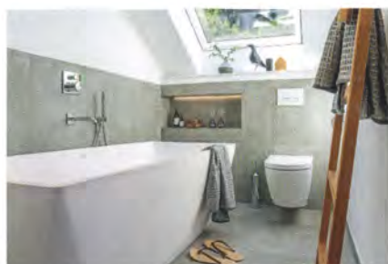
Eine Badewanne aus DuraSolid mit Air-Whirlsystem lädt zum Entspannen ein.

Die Duschzone, früher neben der Tür, wurde auf die gegenüberliegende Seite des Raumes verlegt und profitiert nun vom seitlich einfallenden Tageslicht. In der neu eingezogenen Zwischenwand befinden sich Leitungen und Anschlüsse für die Armaturen. Thermostatmischer, eine große, quadratische Kopfbrause und die Handbrause bieten Duschkomfort. Mit 12 m 2 bot der Grundriss sogar die Möglichkeit, eine Badewanne unterzubringen. Weil die ganze Familie gerne badet, und das auch gemeinsam, fiel die Entscheidung auf ein freistehendes Modell mit zwei Rückenschrägen und integriertem Air-Whirlsystem.