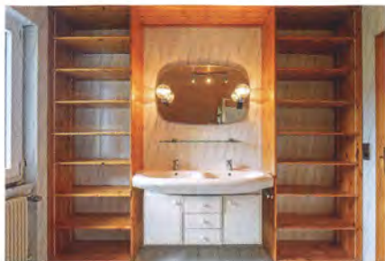
Vorher: Der Waschbereich vor der Sanierung.