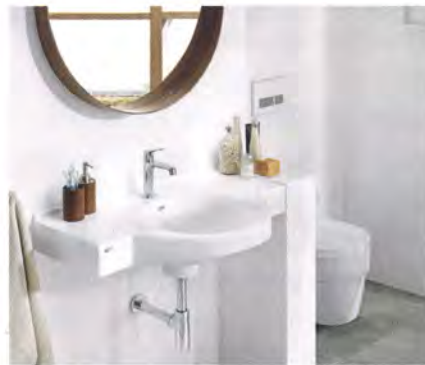
Maßvariabler Varicor-Waschtisch Wetset.

Wohlfühlort: Badewanne aus mattem DuraSolid mit luxuriösem Air-Whirlsystem (DuraSquare, Duravit).